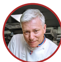
Christian Têtedoie, notre parrain d'exception depuis 7 ans.

Pour moi la plus grande qualité d'un cuisinier est probablement la générosité.